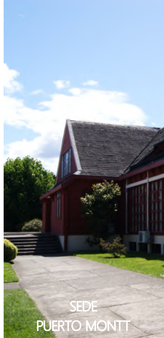
SEDE PUERTO MONTT