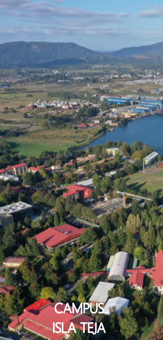
CAMPUS ISLA TEJA